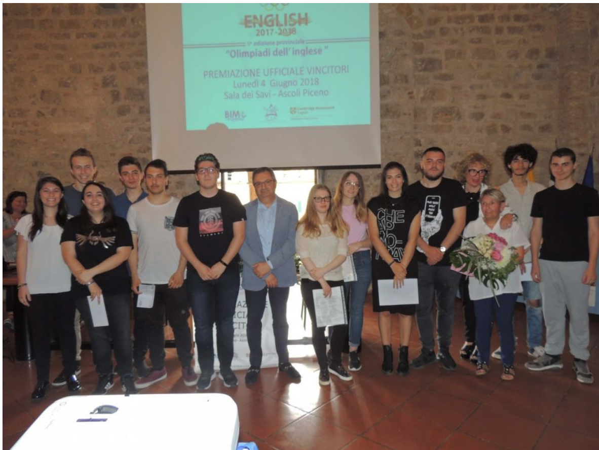
La cerimonia di premiazione a palazzo dei Capitani

Si è svolta lunedì mattina presso la Sala dei Savi di Palazzo dei Capitani la cerimonia di premiazione delle "Olimpiadi dell'inglese" rivolte agli studenti del IV e V superiore di 1° grado dei comuni facenti parte del Bim Tronto. Le Olimpiadi dell'inglese, giunta quest'anno alla quinta edizione provinciale, continuano a promuovere e misurare le competenze linguistiche degli studenti del Piceno, premiando i migliori tra loro. L'interessante e originale iniziativa è stata promossa dal Centro Studi Alfieri, unico Centro Cambridge autorizzato in provincia per il rilascio delle certificazioni della prestigiosa