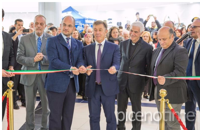
( http://www.picenotime.it/articoli/27918.html )

Ultras 1898: "Ascoli Calcio non può essere utilizzato come giocattolo. Tutti in Corso Vittorio" ( http://www.picenotime.it/articoli/27916.html )