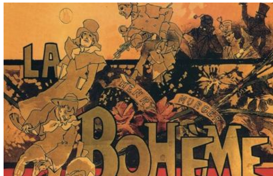
( http://www.picenotime.it/articoli/27532.html )

Teatro Porto San Giorgio, due voci ascolane protagoniste della stagione lirica ( http://www.picenotime.it/articoli/27563.html )