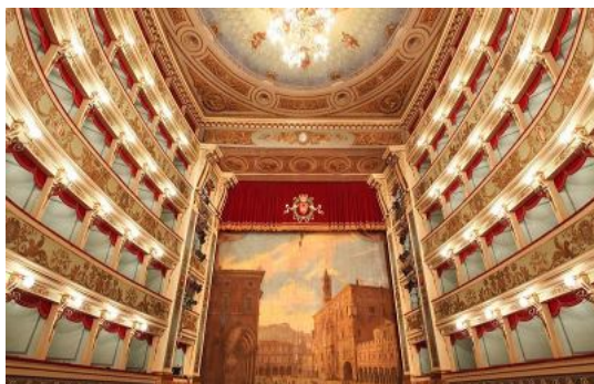
( http://www.picenotime.it/articoli/27456.html )

Ascoli Piceno, cresce l'attesa per "La Bohème" al Teatro Ventidio Basso ( http://www.picenotime.it/articoli/27532.html )