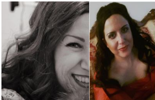
( http://www.picenotime.it/articoli/27563.html )

Teatro Porto San Giorgio, due voci ascolane protagoniste della stagione lirica ( http://www.picenotime.it/articoli/27563.html )