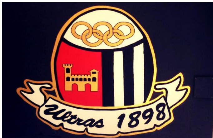
( http://www.picenotime.it/articoli/27916.html )

Ultras 1898: "Ascoli Calcio non può essere utilizzato come giocattolo. Tutti in Corso Vittorio" ( http://www.picenotime.it/articoli/27916.html )