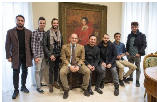
( http://www.picenotime.it/articoli/27455.html )

Ascoli Piceno, al Teatro Ventidio Basso appuntamento con la Bohème ( http://www.picenotime.it/articoli/27456.html )